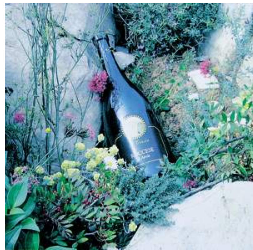
Il "Roccese" rosso nel suo ambiente naturale

In anteprima abbiamo provato direttamente in cantina l'annata 2007, sempre di Roccese Rosso. Rispetto al 2006, parte da una trama più scura alla vista, data la sua giovane età. La prima impressione è che sarà un gran bel vino, simile al suo predecessore, ma con caratteristiche più fruttate, che non diminuiscono il suo fascino. Al palato mostra già un corpo superiore. Attendiamo con grandi aspettative la sua uscita sul mercato, prevista tra giugno e luglio. Giovane cantina, A Trincea, dove si stanno facendo grossi sforzi per creare un ambiente adatto ai vitigni, sempre nel pieno rispetto delle loro caratteristiche. Bellissimi i muretti a secco e tutto il contorno floreale e di erbe aromatiche che interagiscono con i vitigni.